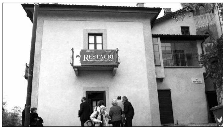
La casa museo di Lodovico Pogliaghi al Sacro Monte

ra in pompa magna (18 ottobre 2008) con intervento delle autorità e l'esposizione di una piccola parte della collezione appartenuta all'artista, l'ingresso risulta chiuso e, come denuncia lo stesso sito internet dedicato a Pogliaghi, lo stabile inizia a mostrare i primi segni di deterioramento degli intonaci esterni. Dopo cospicui interventi di ristrutturazione condotti dalla Fondazione Pogliaghi col sostegno di Provincia, Cariplo, Regione e Fondazione comunitaria del Varesotto, l'impressione è di trovarsi davanti a una nuova stagione di stallo che fa a pugni con la promessa di avviare un ciclo periodico di mostre. Due anni fa monsignor Franco Buzzi dichiarò che i tempi di riapertura era-