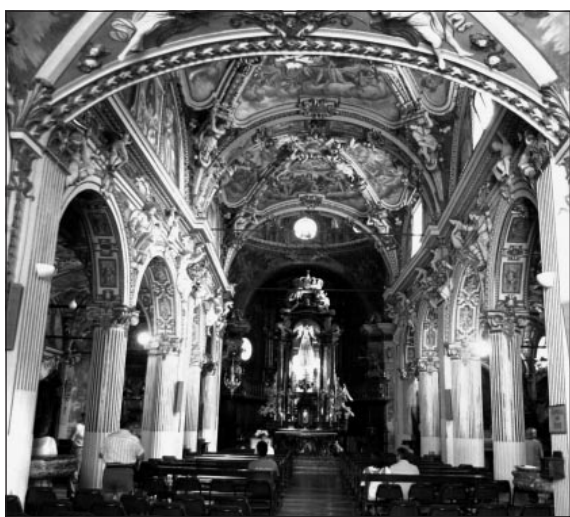
Il santuario di Santa Maria del Monte custodirà una reliquia di don Carlo Gnocchi (a destra)

Una reliquia del beato don Carlo Gnocchi al Sacro Monte. Sembra essere questo l'evento più significativo dell'estate varesina. Circola infatti con sempre maggior insistenza l'indiscrezione secondo la quale, in occasione della prossima edizione della Festa della montagna, il tradizionale appuntamento di Ferragosto con gli alpini al Campo dei Fiori, la sezione dell'Anarcivera in dono dalla Fondazione Don Gnocchi una reliquia del cappellano delle divisioni "Julia" e "Tridentina" beatificata a Milano il 25 ottobre dello scorso anno nel corso di una solenne cerimonia in piazza Duomo presieduta dall'arcivescovo Dionigi Tettamanzi, alla quale parteciparono circa 15.000 alpini. La reliquia, piccola